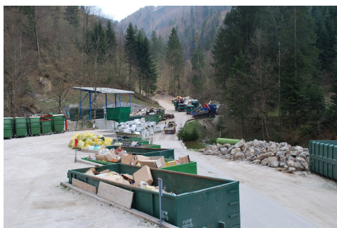
Zbirni center Ljubevč v Idriji